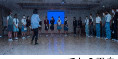
先生からアドバイスを受け、興陽館でファッションショーの秘密練習に取り組む生徒たち。

いよいよ来年度からの新制服を決定する最後の段階となりました。昨年度の生徒総会で、興陽高校をもっと魅力のある高校にするため、制服変更の提案が議決されました。そのあと、デザイン募集・候補選定を進め、夏冬各五候補の試作品が完成しました。この計十着の制服は、在校生には 一学期終業式 、中学生には オープンスクール でファッションショーを行い、生徒たちによる投票で決めます。現在、有志生徒により、シヨールの練習が進められています。まさに、「生徒たちのための制服」です。先生たちからのアドバイスを受け、興陽館でファッションショーの秘密練習に取り組む生徒たち。