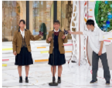
この制服オプションは、OHKの「なんしょん？」というTV番組でも紹介されました。

本校では来年度入学生から新制服となります。言い換えれば、今年度入学生までが現在の制服を着用することになるのですが、この制服にも生徒の意見を取り入れて様々な オプション の追加がされました。女子制服へのリボンが追加され、また男女を問わずスラックスかスカートかを選べるようになり、さらに、夏服には白・水色のポロシャツも追加。生徒からは「リボンがかわいい」、「暑い夏にはポロシャツは快適」と、高評価を得ています。昨今の教育界では、「GIGA