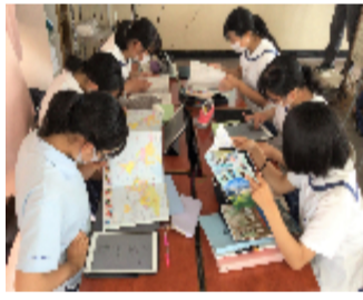
iPadを活用して、調べ学習に取り組む1年生の授業の様子。生徒は真剣に授業に取り組みます。

昨年度は新型コロナウイルスの影響で活動が制限されていた農業クラブの活動も、今年度は新たな形態も取り入れて実施されるようになりました。六月四日には フラワーアレンジメント競技岡山県大会 が本校を会場に行われ、本校からは生徒二名が参加しました。競技の結果、惜