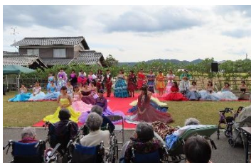
〈ファッションショー〉

10月20日(日)、3年生が高齢者施設「あずみ」を訪問し、施設イベントのオープニングでファッションショーを披露しました。また、ショーの後は、職員の方と一緒に「パプリカ」の歌を振付つきで踊り、交流の機会をもちました。