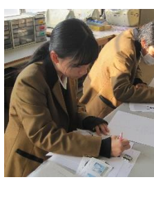
〈テクニカル類型 デザイン画制作〉