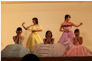
〈ファッションショー〉

11月16日(土)の一般公開の日に、体育館で2・3年生の作品をファッションショー形式で披露しました。また3号館の2階では、授業で制作した作品を、入学当初から順を追って展示しました。ショーで披露する作品づくりに向けて、各学年ごとに取り組んでいる内容をわかっていただけたでしょうか。