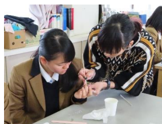
〈ネイルアート講習〉