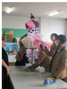
〈デザイン類型 和紙作品〉

12月14日（土）には、被服の検定講座を選択している20名が和服2級の実技試験にのぞきました。結果は1月に届きます。