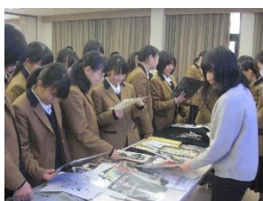
〈生活産業基礎 講義〉